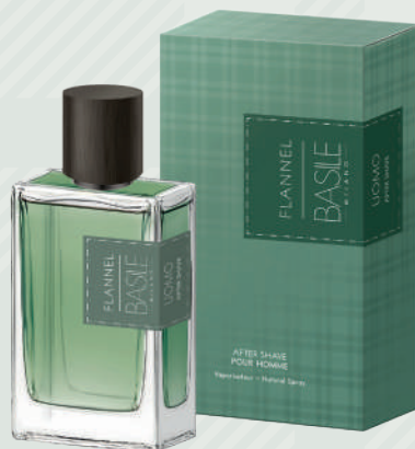
After Shave 100 ml