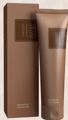
Shower Gel 300 ml Codice BA370008 Ean 8021659009635

PROMOZIONE AL CONSUMATORE SUI PRODOTTI DELLE LINEE