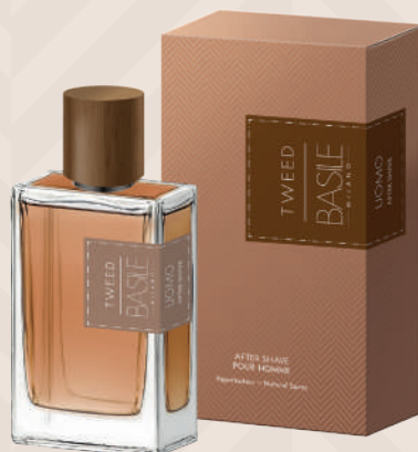
After Shave 100 ml Codice BA370006 Ean 8021659009611