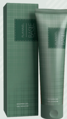
Shower Gel 300 ml