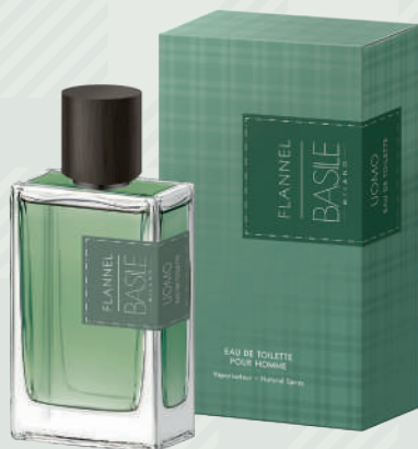
Eau de Toilette 100 ml