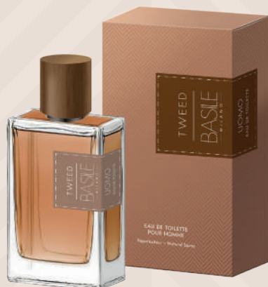
Eau de Toilette 100 ml Codice: BA370005 Ean 8021659009604