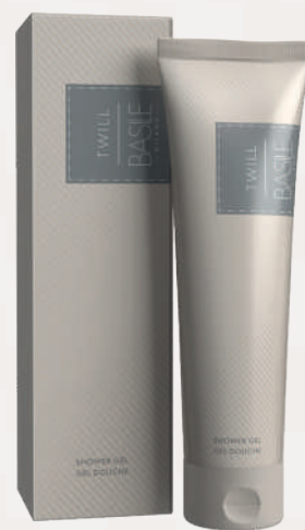
Shower Gel 300 ml Codice BA370004 Ean 8021659009598