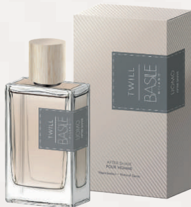
After Shave 100 ml Codice BA370002 Ean 8021659009574