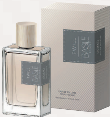
Eau de Toilette 100 ml Codice: BA370001 Ean 8021659009567